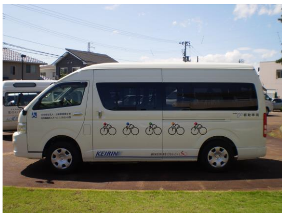
このたび整備した福祉車両