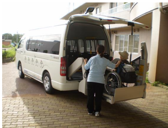
リフトも広々。利用者さんにも好評です